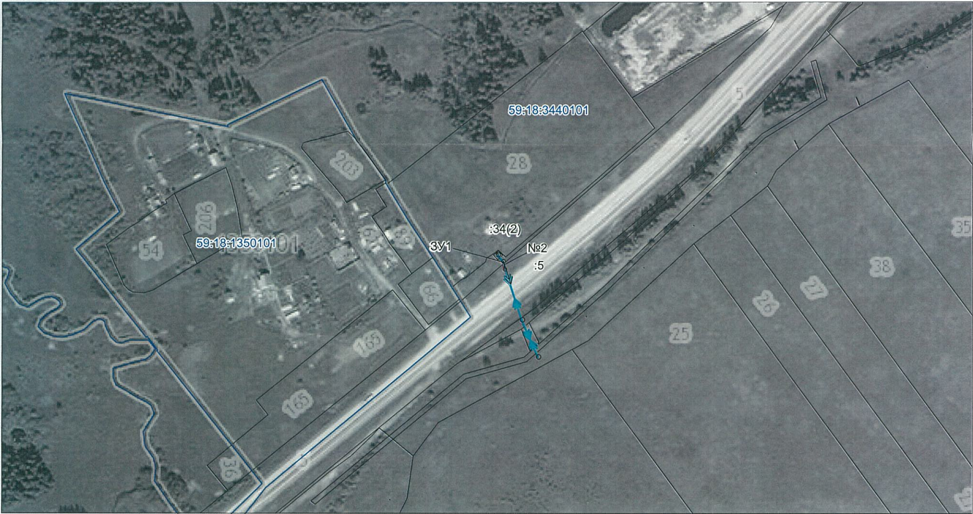
МСК-59, зона 2